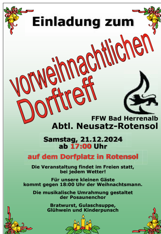
Plakat: FFW Neusatz-Rotensol