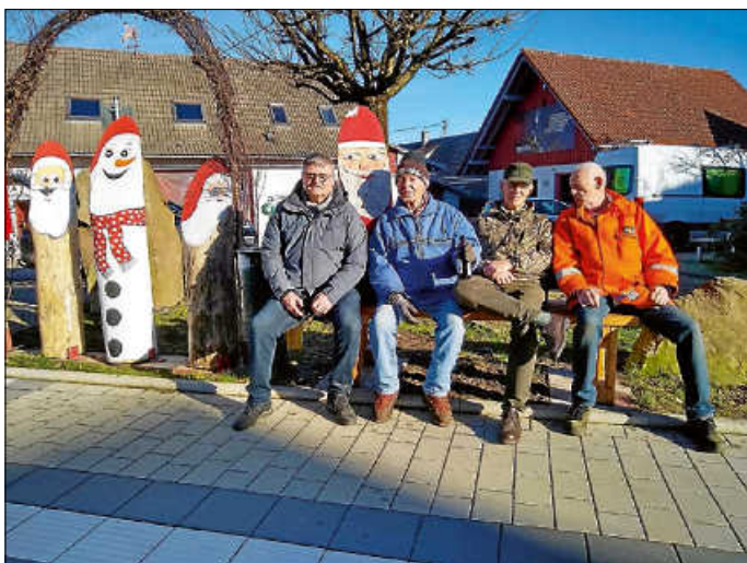
Unsere Alterskameraden nach getaner Arbeit