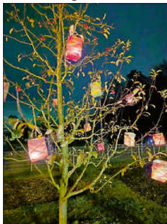
Kinderhaus Wurzelzwerge

„Ich geh mit meiner Laterne und meine Laterne mit mir ...“, klang es am 12. November in den Straßen von Rotensol. Bei Einbruch der Dunkelheit haben sich alle Kinder, Eltern und Erzieher*innen an den vereinbarten Treffpunkten getroffen und sind mit ihren selbstgebastelten Laternen losgezogen. An verschiedenen Haltepunkten wurden Laternenlieder gesungen. Den Abschluss des Laternenumzugs bildete das Schauspiel der Martinsgeschichte, aufgeführt durch unsere Vorschulkinder. Sie haben im Vorfeld fleißig dafür geübt und den Familien eine schöne Vorstellung geboten. Mit Fackeln und einem Lichterbaum im Garten konnten die Familien unser schönes Laternenfest bei einer stimmungsvollen Atmosphäre ausklingen lassen. In unserem Bistro konnten sich alle mit Würstchen, Punsch und