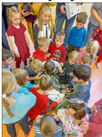
Die Kinder des frisch gekürten Naturpark-Kindergartens in Bad Herrenalb erkunden die Entdeckerkiste der Naturpark-Detektive, die sie zur Auszeichnung geschenkt bekommen haben.

Einen Schwerpunkt hat der Kindergarten darauf gelegt, die Kleinlebewesen in seiner Umgebung zu erforschen. Die Kinder entdeckten den Lebensraum von Fröschen, Schmetterlingen, Schnecken, Eichhörnchen, Maulwürfen, Igel und Regenwürmern. Beim Naturpark-Projekt vom Apfel zum Saft sammelten die Kinder Äpfel von Streuobstbäumen und durften in der Kelter in Bad Herrenalb daraus ihren eigenen Apfelsaft pressen. „Die Kinder lernen, dass auch Obst, das nicht so schön aussieht, seinen Zweck erfüllt und wertvoll ist“, erläutert Härter den Hintergrund des Projekts. Und das praktisch Gelernte bleibt auch nachhaltig in Erinnerung, wie Härter weiter berichtet: „Die Kinder sind stolz auf ihren selbstgemachten Apfelsaft und berichten ihrer Familie, welche einzelnen Schritte dafür notwendig sind.“