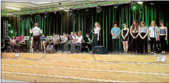
Big Band mit Gesang

und Duette zu hören waren. Die mehrstimmigen Backvoices mit dezenter Choreografie rundeten die Songs zu einem wahren Erlebnis ab. Aber auch ruhige Balladen, welche nur von Klavier und Rhythmusgruppe begleitet wurden, schmückten das Programm. Nicht nur die Besetzung war abwechslungsreich und vielseitig, auch die Auswahl der Stücke reichte von ABBA oder Elvis Presley bis zu neueren Stücken von Adele. Toll, was die Gesangsgruppe unter der Leitung von Frau Huff dieses Jahr gelernt hat. Vor dem Auftritt der Band Rockbottom (Abi-Band 2023) hatte noch die Bläsergruppe ihren Auftritt.