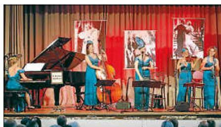
Glanzvoller Abend mit Spendenrekord