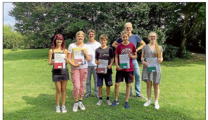
Die diesjährigen Preisträger*innen des Schreibwettbewerbs „Lust am Schreiben“.

Die eingereichten Beiträge reichten von dystopischen Zukunftsvisionen über berührende Geschichten von Menschlichkeit in einer technisierten Welt bis hin zu humorvollen Erzählungen über das alltägliche Miteinander von Mensch und Maschine. Die Vielfalt und Originalität der Geschichten zeigten, wie viel Kreativität und Fantasie in den jungen Autorinnen und Autoren stecken.