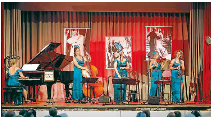
Die Dresdner Salon-Damen begeisterten im Kurhaus.