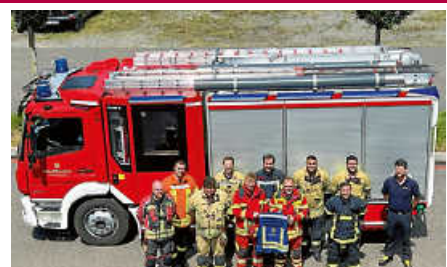
FFW Bernbach hat einen neuen Gruppenführer