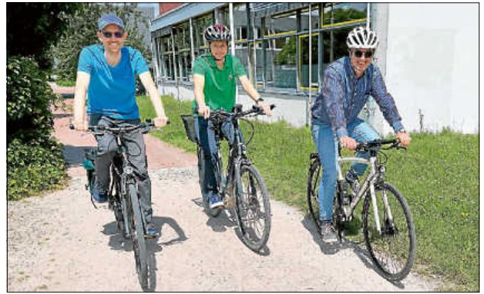
Vom 23.06. bis zum 13.07.2024 heißt es wieder so viele Kilometer auf dem Fahrrad sammeln wie möglich.

Am Sonntag, 23. Juni ist es so weit. Die Aktion Schulradeln in Ettlingen geht in eine neue Runde und bis zum Samstag, 13. Juli sind alle gefragt, um fleißig Kilometer zu erradeln. Egal, ob auf dem Schulweg, dem Weg zum Hobby oder einfach in der Freizeit, jeder Kilometer zählt.