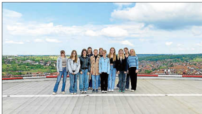
Auf dem Helikopterlandeplatz der SRH-Klinik in Karlsbad.

Der Besuch der SRH Klinik Langensteinbach war für uns Schülerinnen und Schüler ein unvergessliches Erlebnis. Die Möglichkeit, diesen Ausflug im Rahmen unserer Berufsorientierung frei zu wählen, hat es uns ermöglicht, unsere Interessen zu erkunden und unsere Berufswünsche zu reflektieren. Wir sind dankbar für diese Erfahrung und empfehlen jedem, die vielfältigen Berufe im Gesundheitswesen näher kennenzulernen.