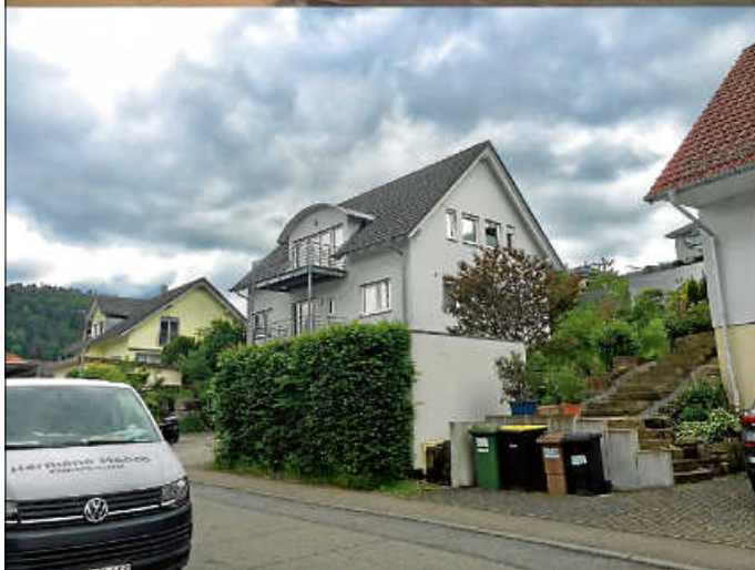
Ein Beispiel für Nachverdichtung: Am Standort der ehemaligen Klostertbrauerei stehen jetzt Wohnhäuser.

Ziel der Veranstaltung am 04.06.2024 ist es, zunächst interessierten Bürgerinnen und Bürgern den Bedarf und die Ziele einer strategischen Planung der Stadtentwicklung aufzuzeigen. Diese stellt schließlich die Grundlage dar, wie Bad Herrenalb in einigen Jahren aussehen wird und ist ein wesentliches Element zur Gestaltung der Lebensqualität in der Stadt Bad Herrenalb. Das im Gemeinderatsbeschluss adressierte Grundstück ist hierbei nur ein Beispielvorgang: Es geht um die Erarbeitung eines ganzheitlichen Vorgehens.