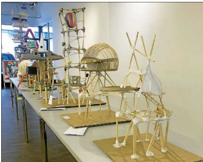
Modelle der Schülerinnen und Schüler zum Thema „Wohnen zwischen Himmel und Erde“

Am 7. Mai fand im Architekturschaufenster Karlsruhe die Preisverleihung des trinationalen Schülerwettbewerbs „Oskar“ statt. Das diesjährige Thema lautete „Wohnen zwischen Himmel und Erde“ und forderte die Kreativität der Kinder im positiven Sinne heraus. Gelobt wurde von der Jury die hohe Qualität aller Einreichungen, die die Entscheidung für die Prämierung nicht leichtgemacht habe. Vom Wohnen in der Palme über Häuser auf Stelzen und bewohnbare Flugobjekte bis hin zur Mondstation bewegten sich