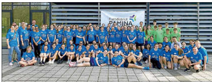
72 Mädchen aus Baden, dem Elsass und der Pfalz kamen am 8./9. April 2024 zum PAMINA-Ballspiel-Cup zusammen.

Am 8. und 9. April fand der diesjährige PAMINA-Ballspiel-Cup der Mädchen statt. Soufflenheim im Elsass war in diesem Jahr Austragungsort der Veranstaltung und so fanden sich die Sportlerinnen und ihre betreuenden Lehrerinnen und Lehrer aus der Pfalz, dem Elsass und aus Baden am College Albert Camus in Soufflenheim ein.