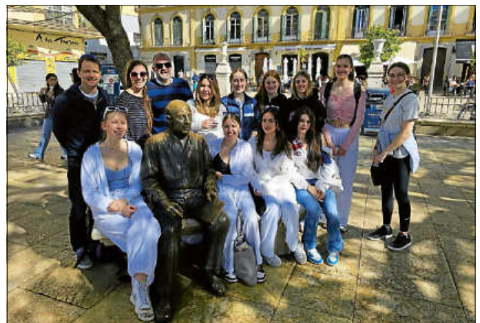
Gruppenbild mit Pablo Picasso.

Auch in diesem Jahr konnten wir wieder einen Schüleraustausch mit unserer Partnerschule in Málaga durchführen, auch wenn sie dieses Mal leider nur 10 Plätze anbieten konnte.