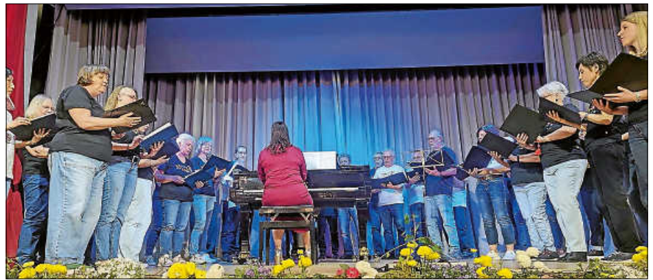
Der Sunshine-Chor begeisterte mit seinen Interpretationen von „California Dreaming“ und „Bohemian Rhapsody“.