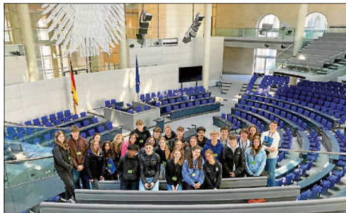
Die 10c auf der Besuchertribüne des Plenarsaals.

schnell unser Gepäck abstellten, damit wir rechtzeitig zum Plenarsaal-Vortrag im Bundestag eintrafen. Nach unserem erfolgreichen Security-Check erkundeten wir das Reichstagsgebäude. Bei schönstem Wetter konnten wir selbstständig die Glaskuppel besteigen. Da bis zum Abendessen im Hostel noch ein wenig Zeit war, beschlossen wir das Brandenburger Tor zu besichtigen und einen kurzen Halt für das erste Fotoshooting (eines von vielen) einzulegen. Danach fuhren wir mit der U-Bahn zurück in unsere Unterkunft, wo wir unsere Zimmer bezogen und ein leckeres Abendessen mit Nachtisch genießen konnten.