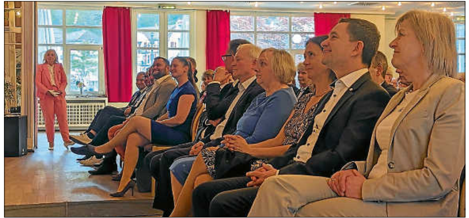
Die Ehrengäste in der ersten Reihe des Kurhauses.