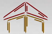
Aussichtsturm "Neusatzter Pfütz"