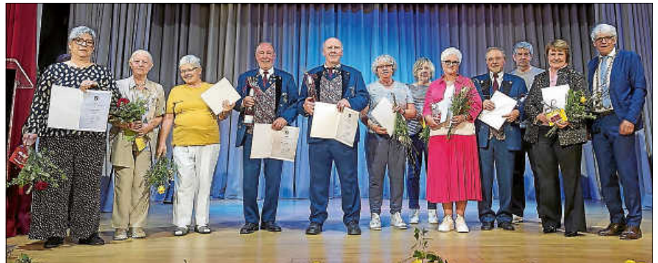
Die Stadt bedankt sich nochmals bei allen Geehrten für ihr außerordentliches ehrenamtliches Engagement zum Wohle der Stadt.