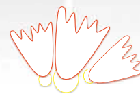
Badminton Sportfreunde Neusatz - Bad Herrenalb