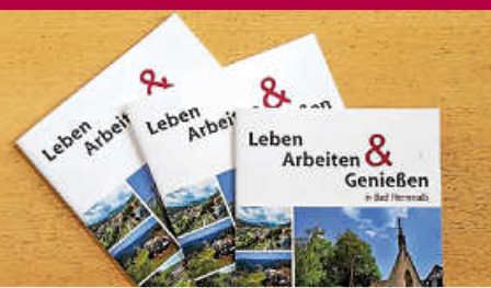
Bürgerbroschüre „Leben, Arbeiten & Genießen in Bad Herrenalb“ veröffentlicht