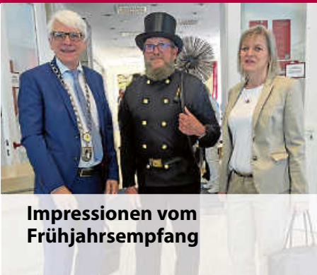
Impressionen vom Frühjahrsempfang