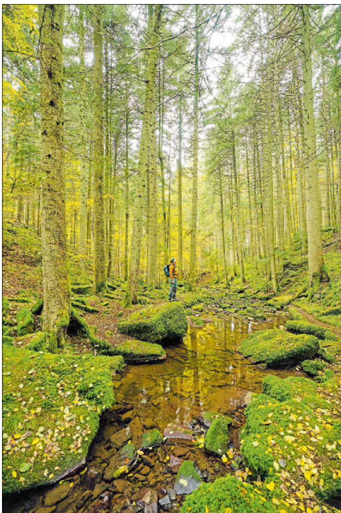
Auf der CMT in Stuttgart präsentiert sich der Nördliche Schwarzwald als Wanderregion.