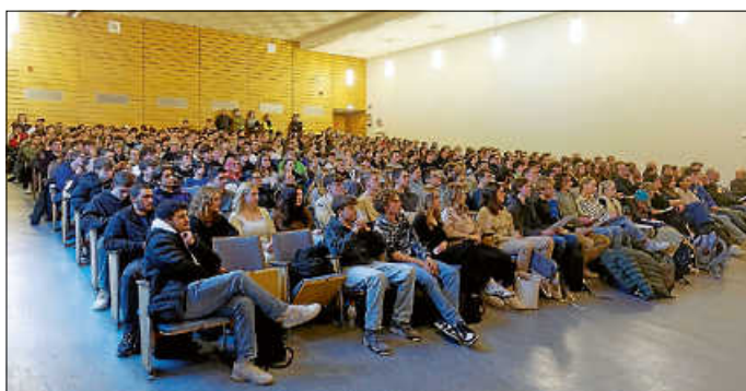
An der Podiumsdiskussion nahmen alle drei Ettlinger Gymnasien teil.

Was ist uns unsere Freiheit wert? Ist unsere Demokratie gefährdet? Wie kann ich mich als Jugendliche:r für meine Interessen einsetzen? Diese Fragen bildeten den Leitfaden für die Podiumsdiskussion am Dienstag, 12. Dezember. Das Bürgerforum Ettlingen hat dazu die Oberstufen aller drei Ettlinger Gymnasien in die Aula des Eichendorff-Gymnasiums eingeladen.