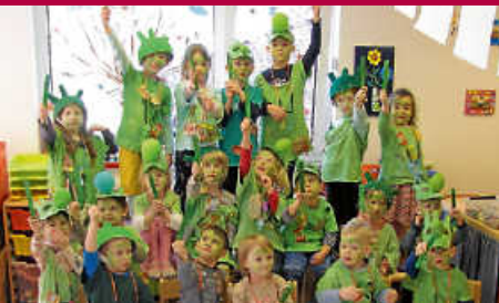
Fasching im Kinderhaus Regenbogen