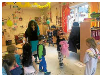
Besuch von einer Nebelhexe

4 Tage lang konnte man lautes, lustiges und wildes Treiben im Kinderhaus Regenbogen erleben. Die verkleideten Kinder konnten nach Lust und Laune tanzen, sich schminken lassen oder sich in ein ruhiges Eck zurückziehen. Hungrig bleiben musste dank der fleißigen Eltern auch niemand und so gingen die Faschingstage rucki zucki vorbei. Besonders gefallen hat es den Kindern, dass das Kinderhaus-Regenbogen-Kino wieder geöffnet hatte (das kommt nur wenige Male im Jahr vor) und „Der Grüffelo“, „Für Hund und