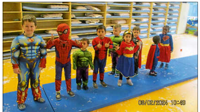
Modenschau der Superhelden

Am Freitag fand eine riesengroße Pyjamaparty statt. Alle Kinder und pädagogischen Fachkräfte kamen in ihren Schlafanzügen. Dies war nach der riesen Faschingssause vom Vortag auch wirklich nötig :-)