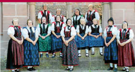
Trachtengruppe Bad Herrenalb e. V. – Wir stellen uns vor!