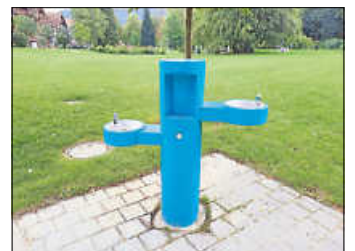
Trinkbrunnen im Kurpark

Im Trinkpavillon und in der Siebentäler Therme ist das Trinkwasser jedoch weiterhin kostenlos für Bürger:innen und Gäste verfügbar.