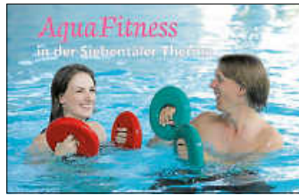
AquaFitness - Bewegung die Spaß macht

Bessere Kondition, kräftigere Muskulatur, weniger Bauch, straffere Haut und oft auch weniger Schmerzen bei Krankheiten am Bewegungsapparat