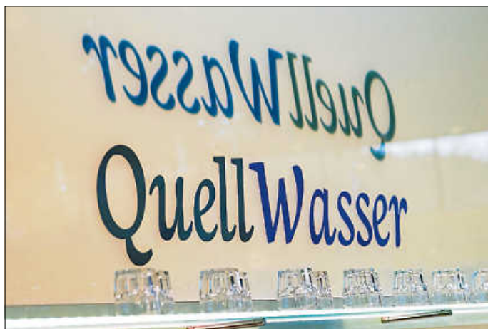
Quellwasser in der Siebentäler Therme