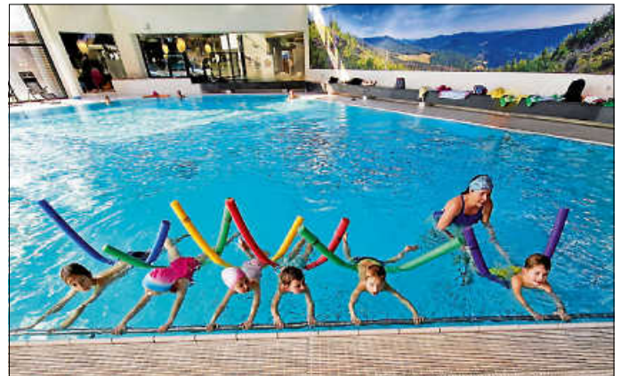
Kinderschwimmkurs in der Therme