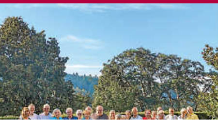
Renate-Haack-Stiftung: Gäste aus Köln in Bad Herrenalb eingetroffen