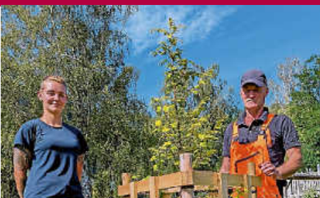
Mammutbäume auf der Schweizerwiese gepflanzt