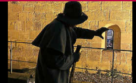
Nachwächterwanderung am 11. August