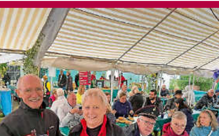
Klosterfest begeistert trotz Wetterkapriolen