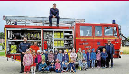
Kita Wurzelzweige: Eine Woche voller Überraschungen