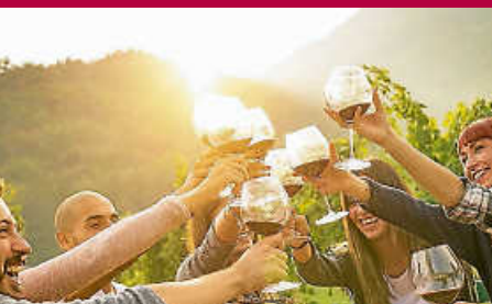
Weinfest am Kurhaus am 11. und 12. August