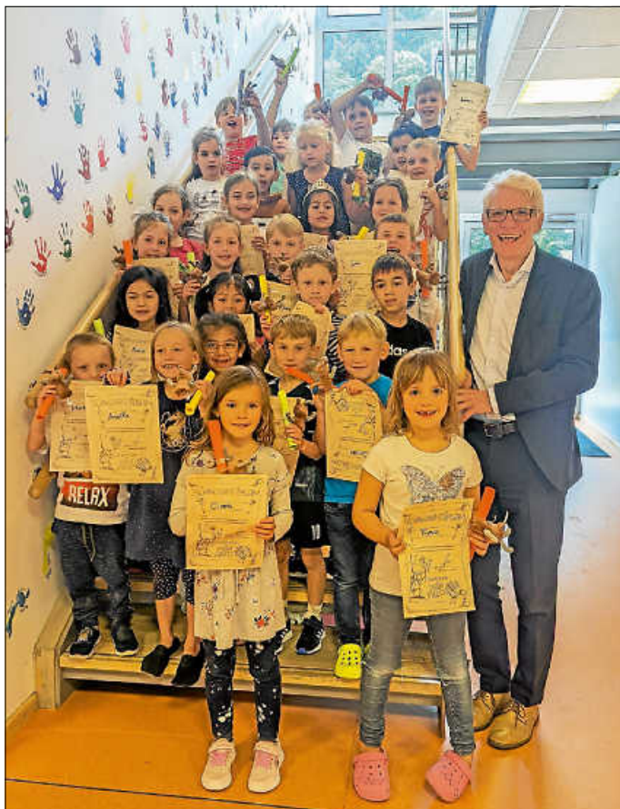
Die kleinen Forscher aus den Kinderhäusern „Regenbogen“...