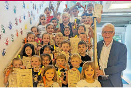
Diplome für kleine Forscher