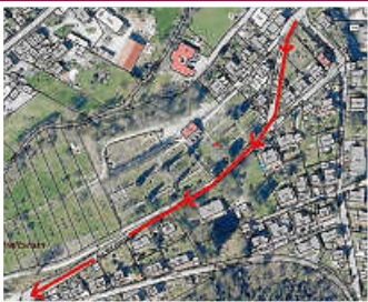
Einbahnstraßenregelung am Klosterfest-Wochenende