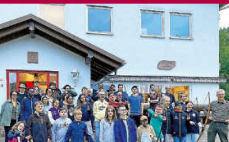
Unvergesslicher Besuch im Schützenhaus