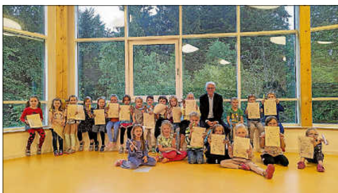
...und „Wurzelzwerge“ zeigen stolz ihre Diplome.