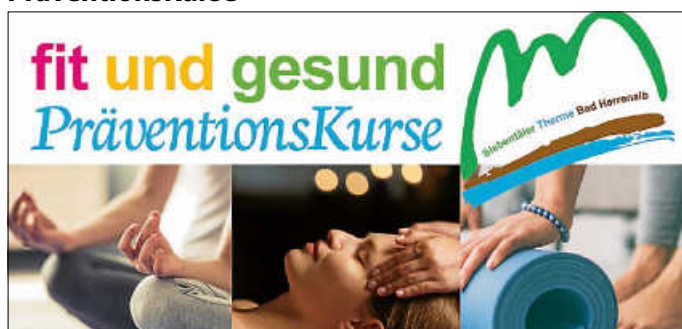
Prävention - Vorbeugen und Geld sparen!