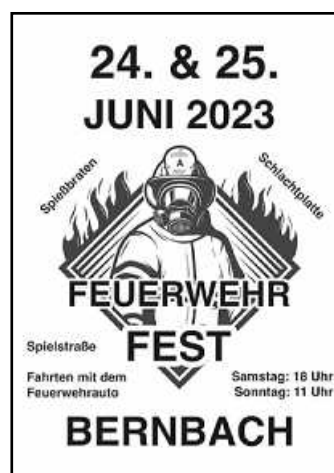
Plakat: Feuerwehr Bernbach

Aktive Übung 22.06.2023 ab 19 Uhr 06.07.2023 ab 19 Uhr 07.07.2023 ab 19 Uhr Jugend Übung 19.06.2023 ab 17 Uhr 03.07.2023 ab 17 Uhr 17.07.2023 ab 17 Uhr