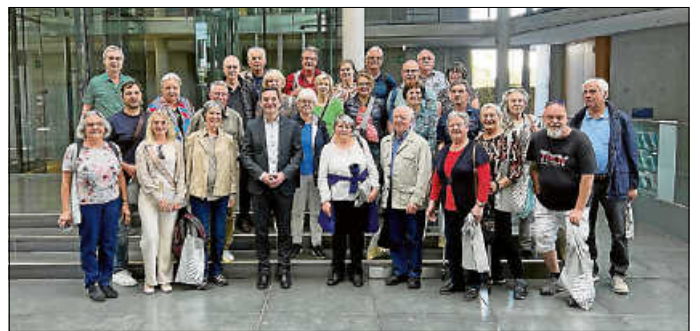
Die UBV zu Besuch bei Klaus Mack (MdB) (erste Reihe, 4. v.l.) in Berlin.

28 Personen umfasste die Personengruppe der UBV, welche am Donnerstag, dem 11.05 mit dem Zug frühmorgens die Bahnreise nach Berlin antrat und – pünktlich – nach Fahrplan das Hotel in der Nähe des Regierungssitzes beziehen konnte. Nachmittags und bis in die Abendstunden waren erste Erkundungsfahrten mit Bus, U-Bahn, Strab und Spaziergänge in der Stadt angesagt.