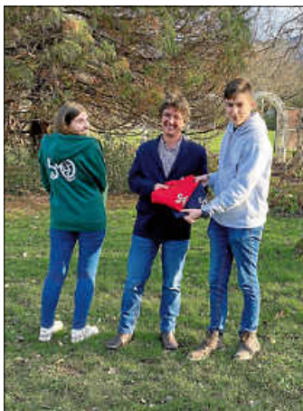
Ein Highlight bei der Schulkleidung zum 50. Geburtstag des AMGs stellt der Sonderdruck vorne und hinten dar.

Ab April 2023 gibt es eine weitere Bestellrunde. Dann werden wir wieder den Link zu unserem Anbieter freischalten, damit Sie direkt online bestellen und bezahlen können. Die Oberteile werden dann spätestens zu unserem Schulfest verteilt. Einzelne Teile mit Standard AMG Druck sind aber auch im Fundus vorrätig. Bei Rückfragen und für weitere Informationen können Sie sich gerne direkt an das Team der Schulkleidung unter https://amgettlingen.de/service/schulkleidung wenden.