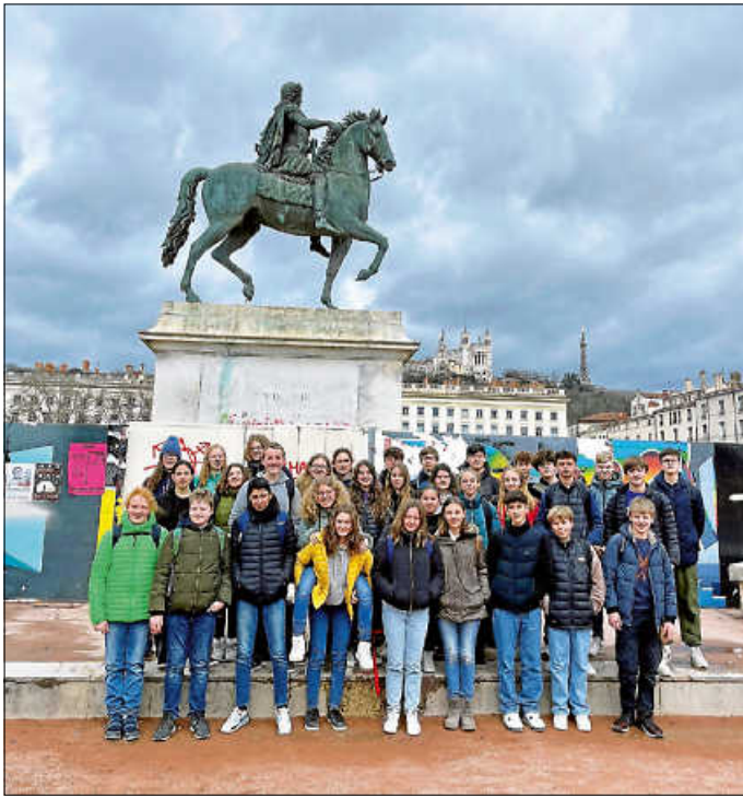
Bei dem Gegenbesuch der Ettlinger in Belleville stand die Besichtigung der Stadt Lyon auf dem Programm.