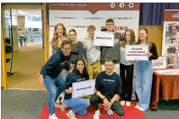
Mut auf „mehr“ bei der Berufsorientierung